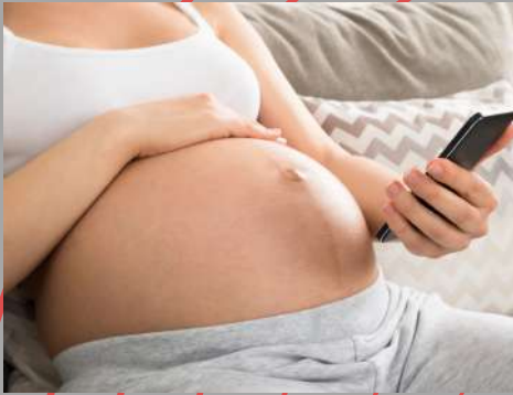
...schwängere Frauen und ihr Fötus...

Lieber einmal mehr möchten wir Sie vor den irreversiblen Schäden von Elektrosmog warnen, die eine unsichtbare Gefahr für diese besonders schützenswerten Gruppen darstellt: